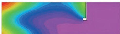
ANTES DE LA INSTALACIÓN